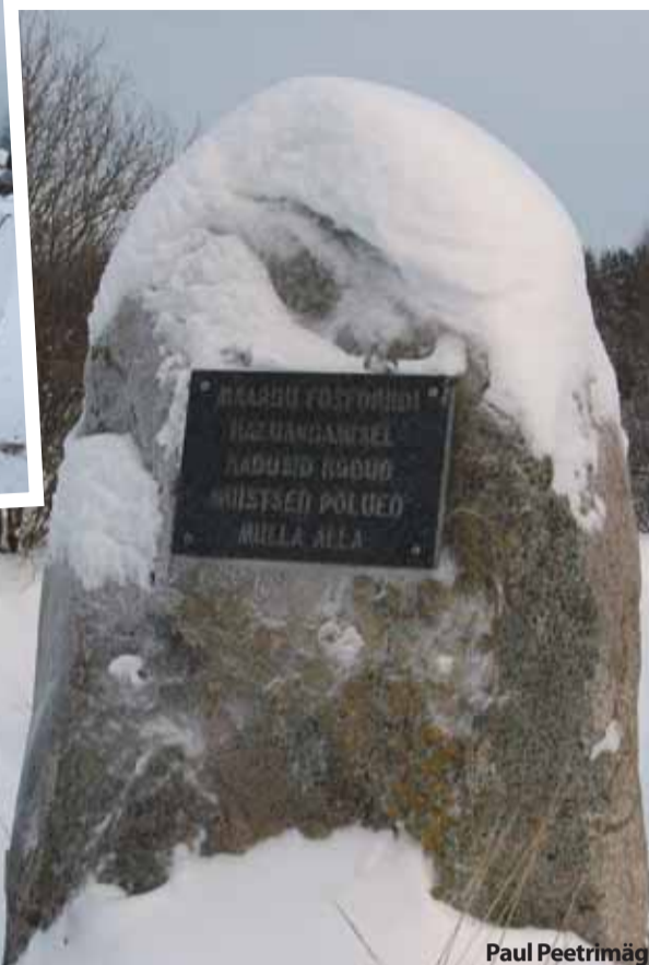
► Mälestuskivi kadunud Võerdla külale prügila tee ääres.