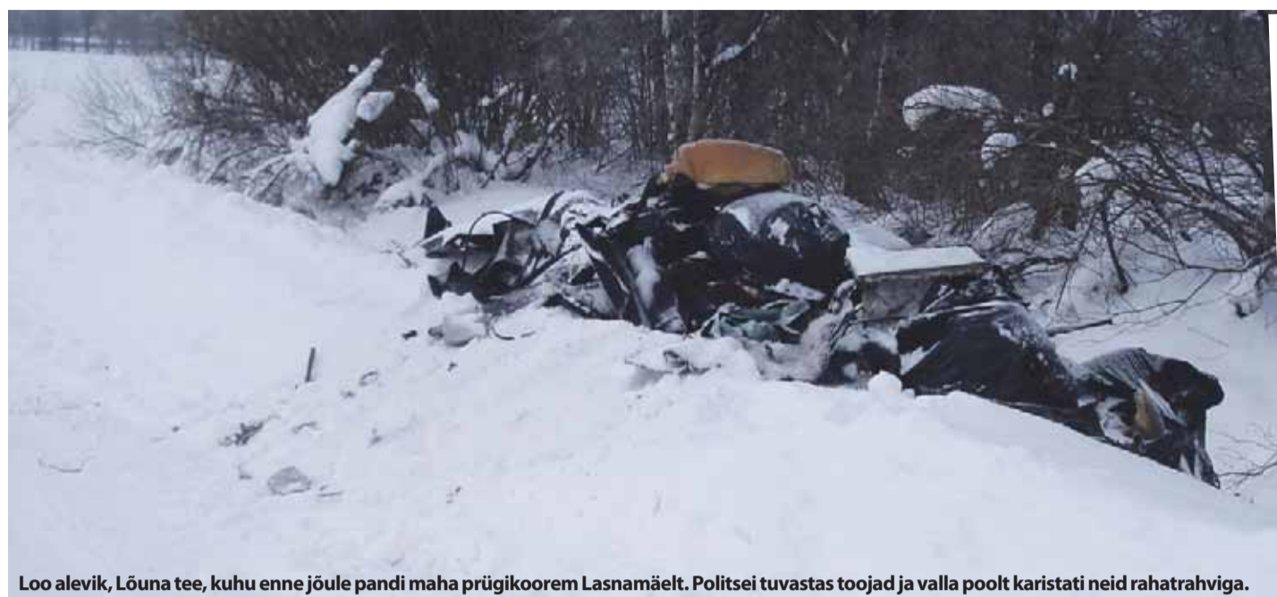
Loo alevik, Lõuna tee, kuhu enne jõule pandi maha prügi koorem Lasnamäelt. Politsei tuvastas toojad ja valla poolt karistati neid rahatrahviga.